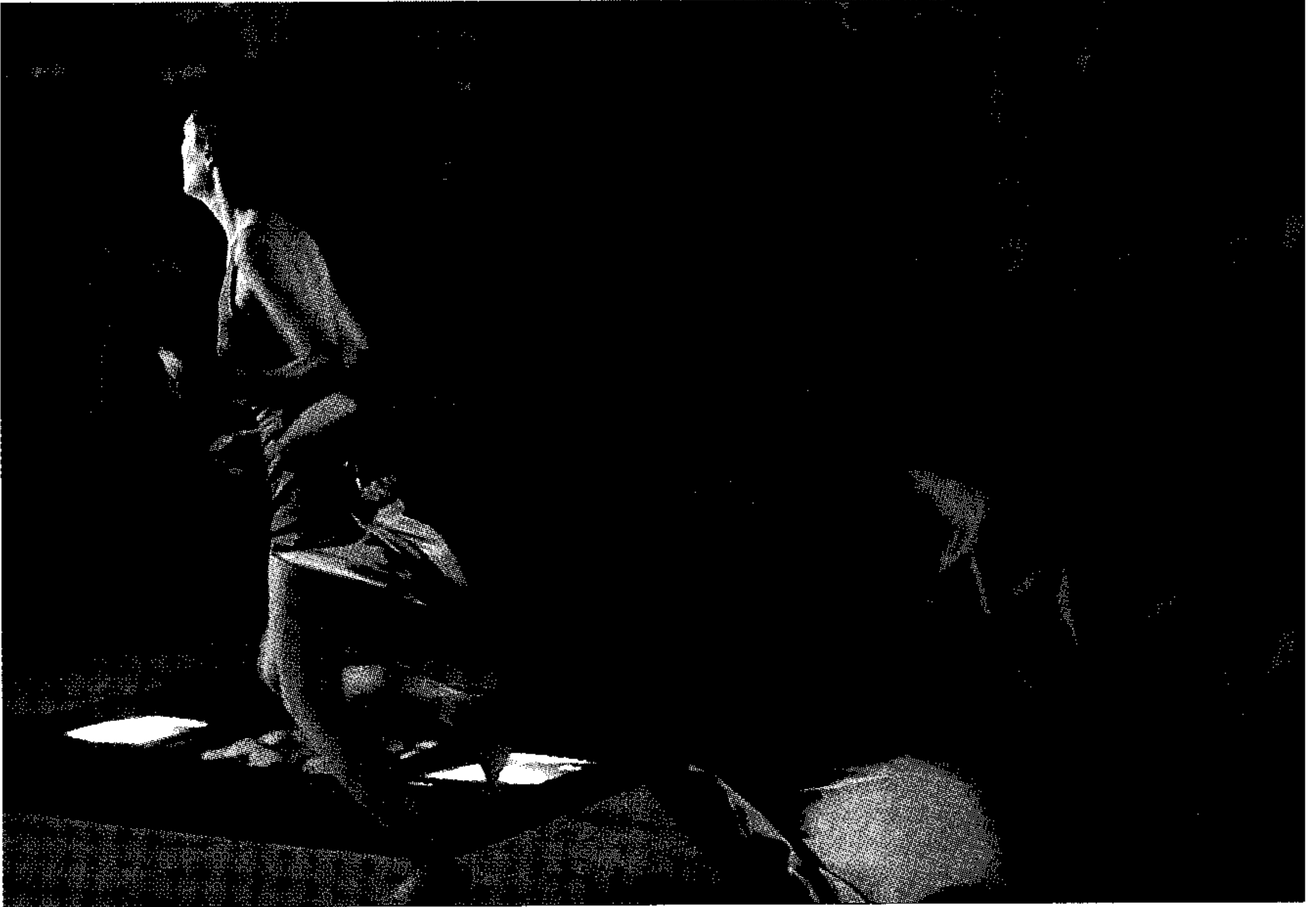
秦大慶執導的《馬己仙峽道》述說半山區的虛浮華靡故事